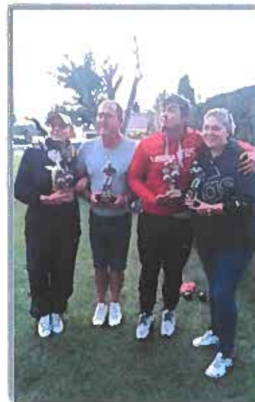
Photo des finalistes